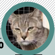
FAIRYBERENDEY FLOSSY.

РУЧНЫЕ ИЛИ ДИКИЕ? НА САМОМ ДЕЛЕ О НИХ МОЖНО ГОВОРИТЬ И РАССКАЗЫВАТЬ ДО БЕСКОНЕЧНОСТИ. Я ПОСТАРАЮСЬ РАССКАЗАТЬ О КОШКАХ ЭТОЙ ПОРОДЫ, В КОТОРЫХ САМА ВЛЮБИЛАСЬ С ПЕРВОГО ВЗГЛЯДА, В РАМКАХ ЖУРНАЛЬНОЙ СТАТЬИ.